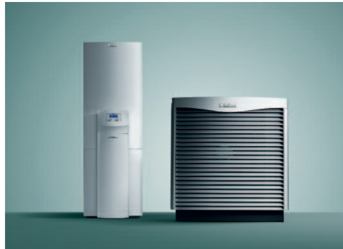
Intelligente Technik für vollen Heizkomfort: Innen- und Außeneinheit einer modernen Luft/Wasser-Wärmepumpe.

Luft/Wasser-Wärmepumpen zählen zu den effizientesten Heiztechnologien. Durch die Nutzung der in der Außenluft gespeicherten Sonnenenergie für Heizwärme setzen sie auf natürliche Energiequellen und schonen dabei nachhaltig die Umwelt. Bis zu 75 % des Heizwärmebedarfs können kostenlos aus Umweltwärme gewonnen werden, nur noch ein Viertel wird als Antriebsenergie über das Stromnetz bezogen. Ein weiterer Vorteil von Luft/Wasser-Wärmepumpen: Sie lassen sich schnell und ohne großen Aufwand realisieren, da weder Brunnenbohrung noch Erdreicharbeiten erforderlich sind.